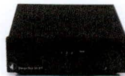
PRO-JECT Amplificador St Box S2 Bluetooth S/ 1,299 (Internet)