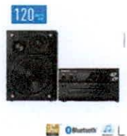
PANASONIC Microcomponente Bluetooth SC-PN S/ 999 (Interr)