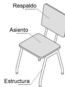
Figura N° 1. Partes de la silla