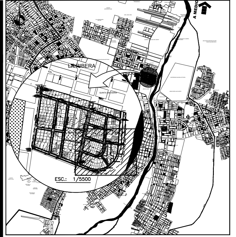
PLANO UBICACIÓN ESC.:1/50 000