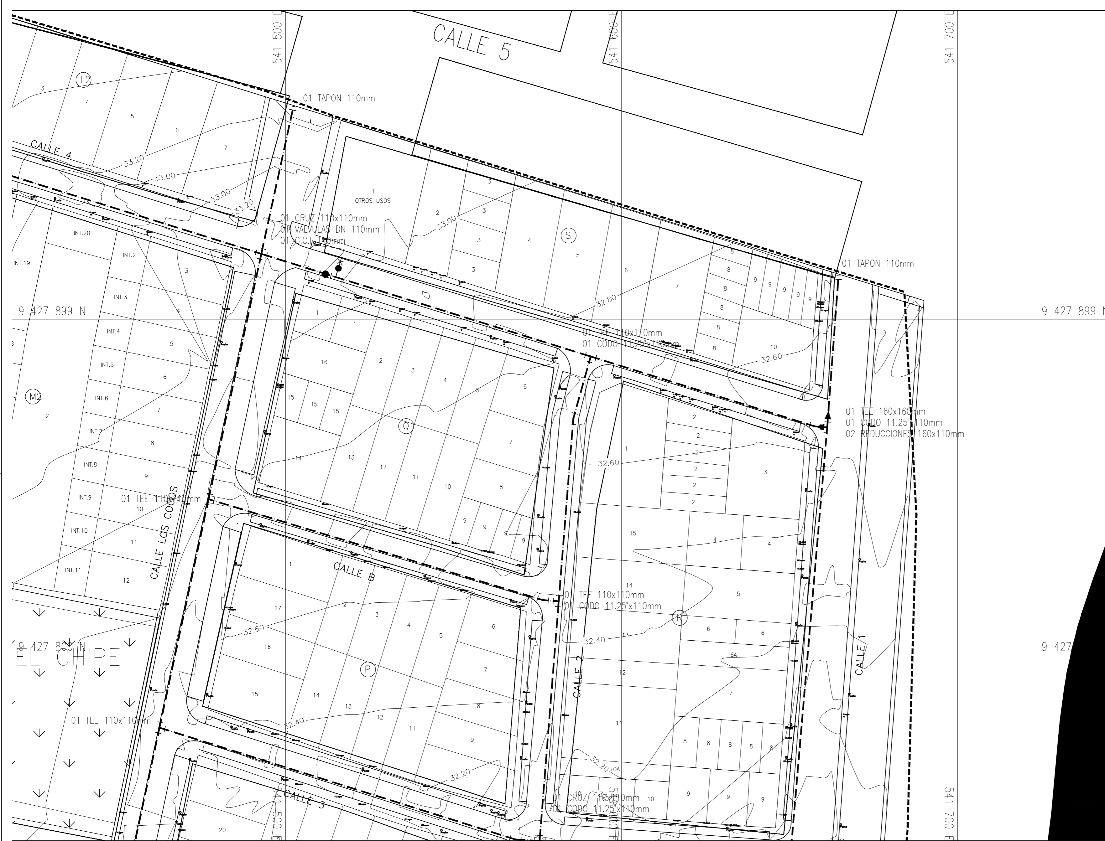
PLANO: AGUA POTABLE PROYECTADO ESC.: 1/500