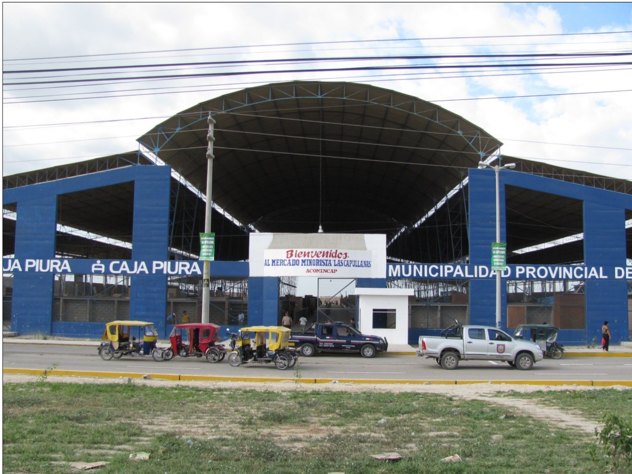
Puesta en Funcionamiento - Mercado Minorista Las Capullanas