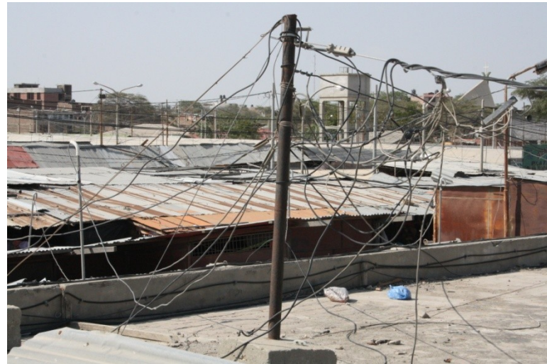
Situación Complejo de Mercado