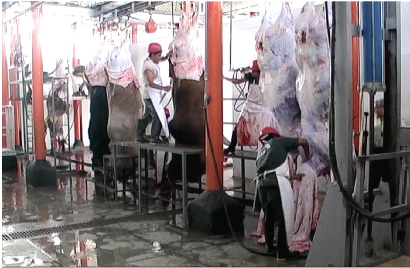
Funcionamiento de Matadero Frigorífico Municipal de Piura Sacrificio de Ganado