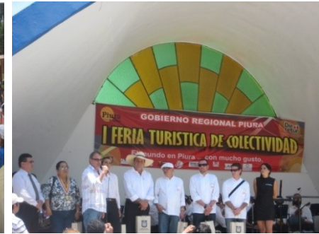
FERIA DE COLECTIVIDAD EMBAJADORES MARCA PERU EN PIURA