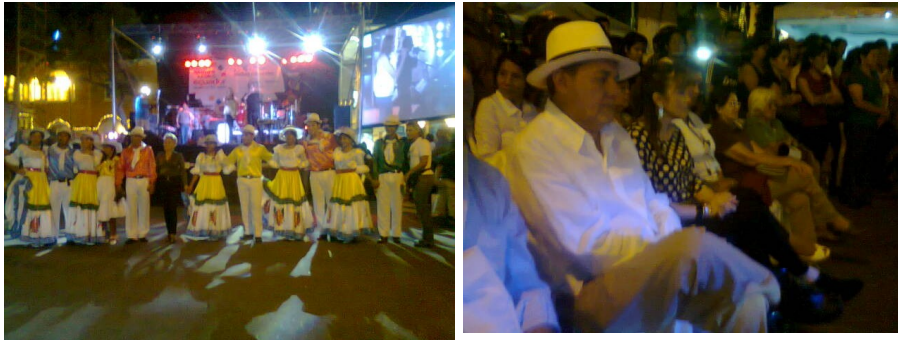
FORTALECIMIENTO BINACIONAL PERU ECUADOR - VITRINAS TURISTICAS