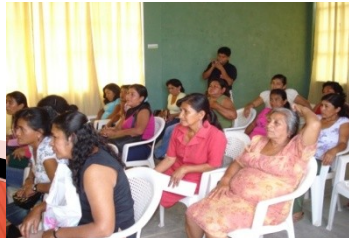
CAPACITAC. ARTESANAS - CREDITO SBS.