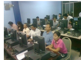
BRIGADA TURISTICA Y MYPES SE CAPACITAN EN TICS.