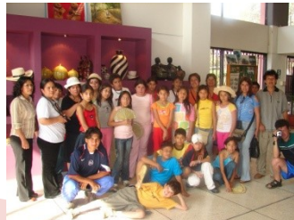
VISITAS TURISTICAS GUIADAS