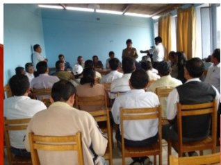
TRC EN TAMBOGRANDE